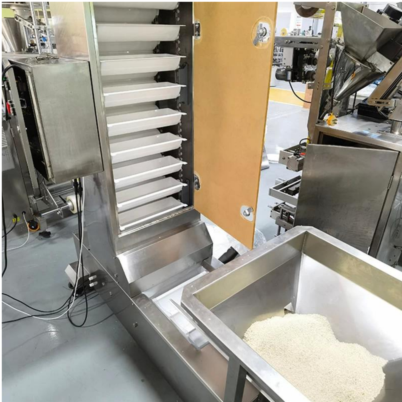
Thang máy loại Z