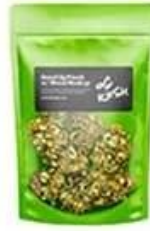
Stand up pouch bag