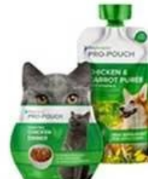
Special shaped bag