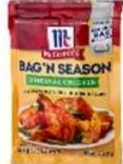
3/4 side seal bag