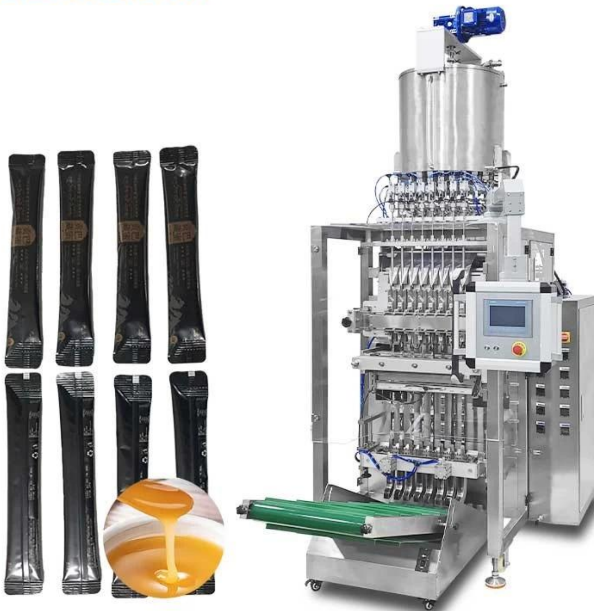
hình ảnh chi tiết