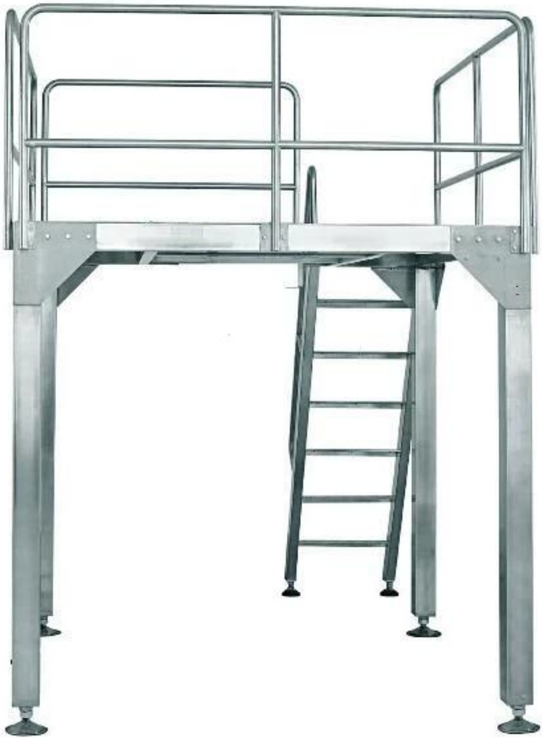
hình ảnh chi tiết