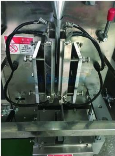
CUTTING AND SEALING PART