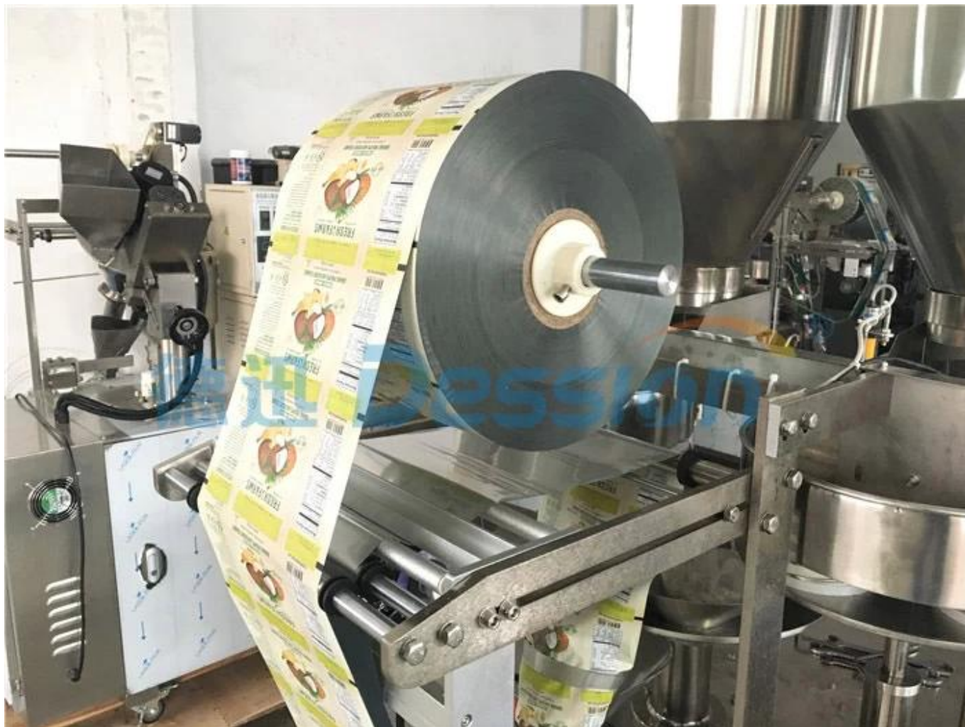
4. Kéo phim