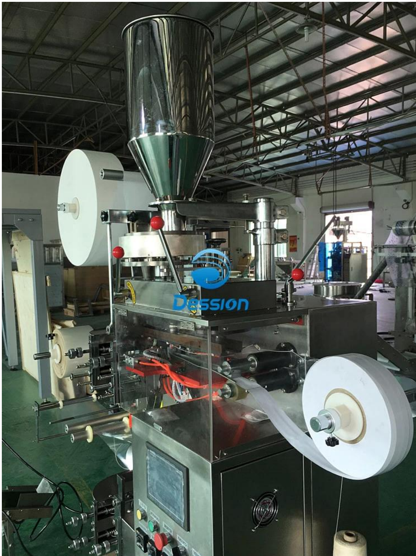
Quy trình máy cho Máy đóng gói trà