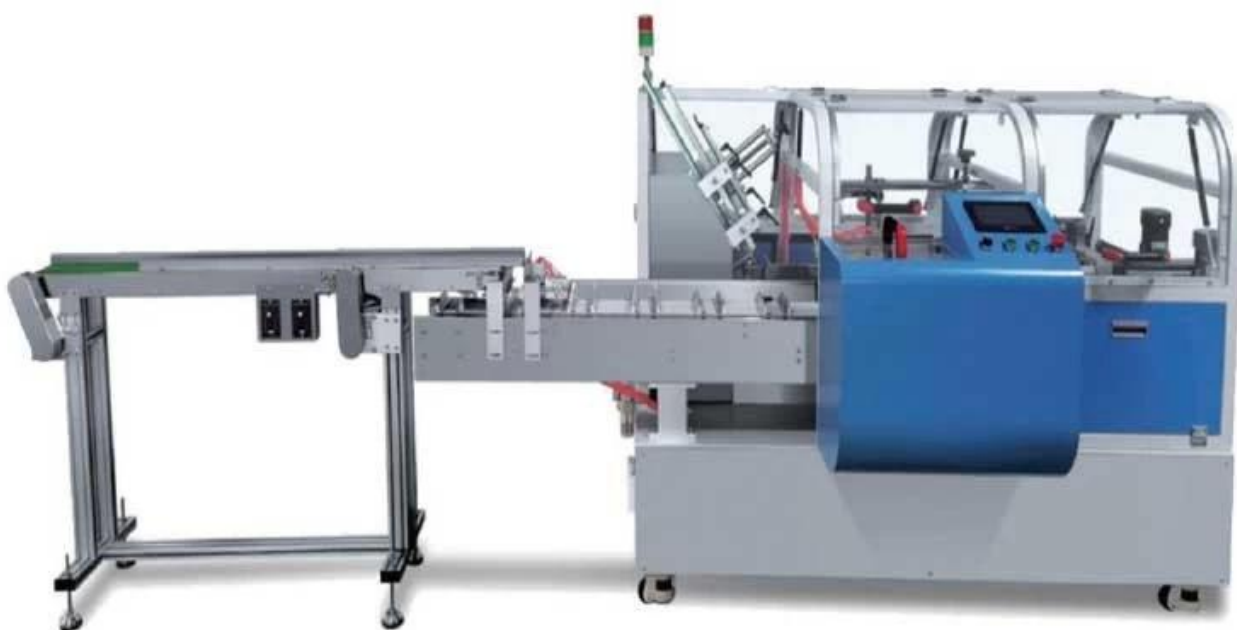
Hình ảnh chi tiết