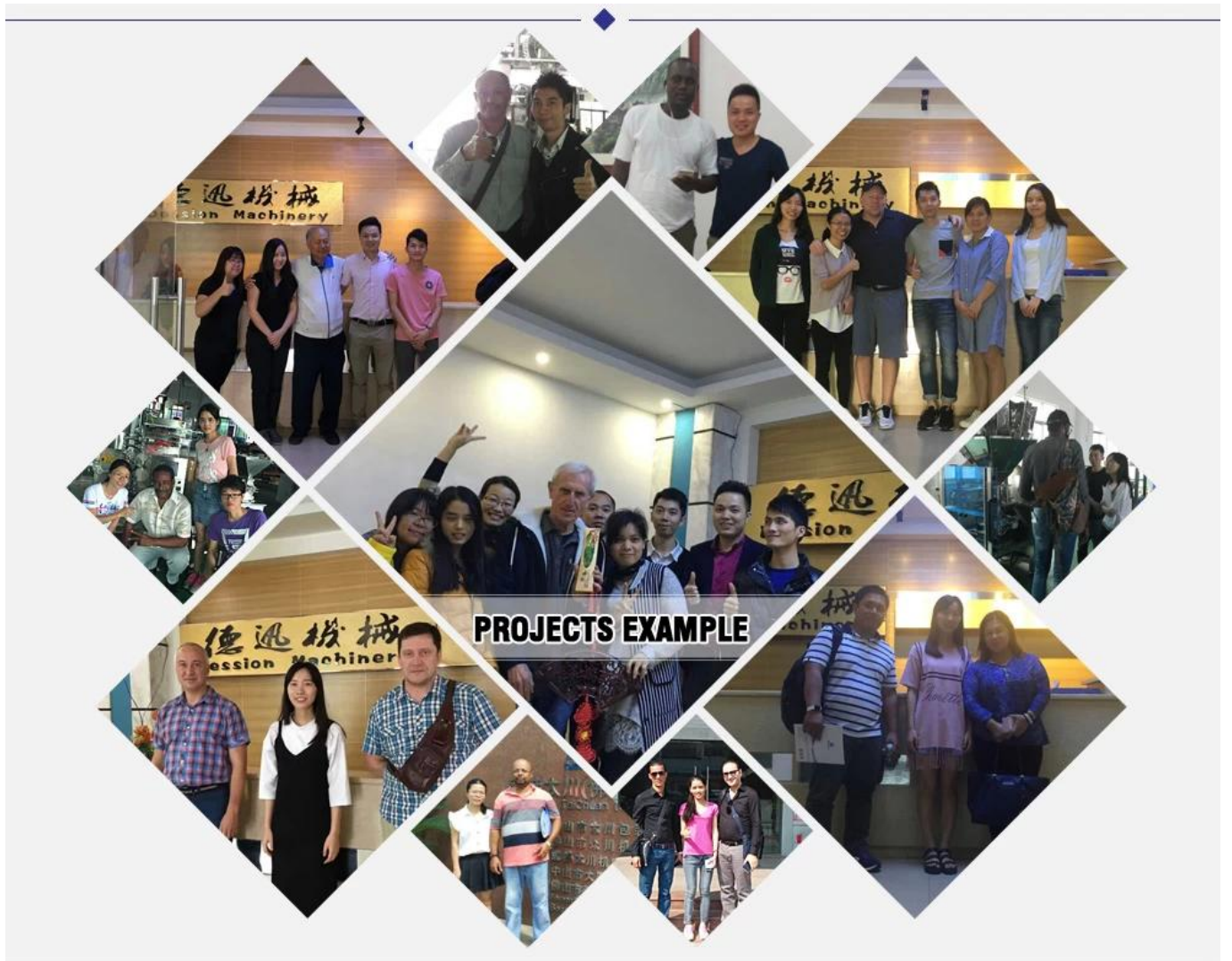
máy đếm và đóng gói tự động vít đai ốc bu lông đình