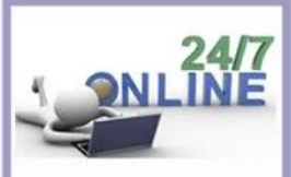
7-24 Hours services