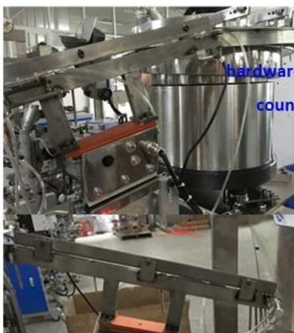
hardware screws/nuts/bolts nails/fastener, counting package solution