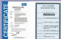
Tight quality control