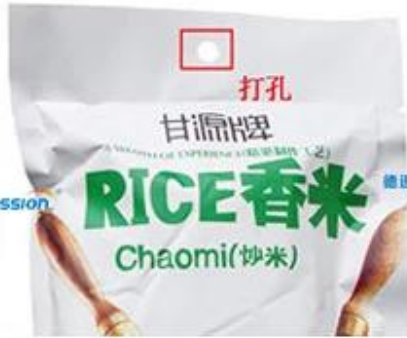
Round Punching Hole