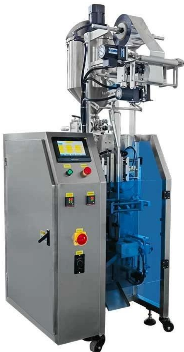
Hình ảnh chi tiết