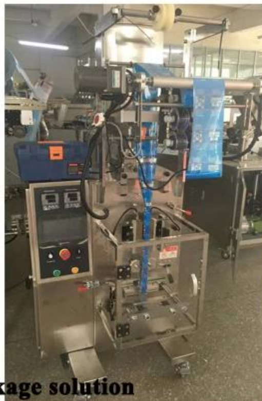
Sachet tomato ketchup package solution 20L hopper for liquid storage, can be customized