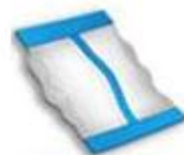
Standar pillow bag